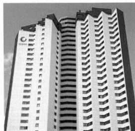
Referenzobjekt: Hochhaus Berlin Gropiusstadt, Zwickauer Damm

Das REGEL-air System funktioniert hervorragend, und wir können es jedem weiterempfehlen. In keiner Wohnung, wo wir das System verbaut haben, ist Schimmel aufgetreten.